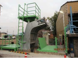
山崎除塵機・分水工