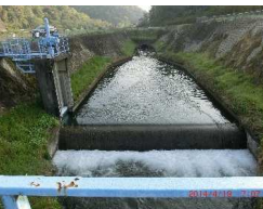
二番橋門・洪水吐