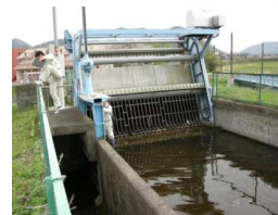
山田川サイホン除塵機・洪水吐