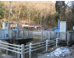
一番橋門・洪水吐