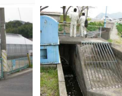
伊吹サイホン洪水吐