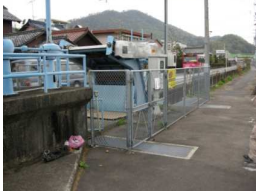
土山除塵機・分水工