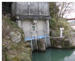
小瀬取り入口水門