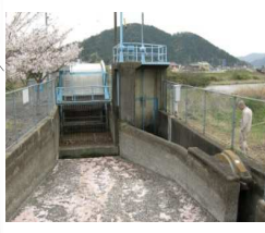
津保川サイホン除塵機・洪水吐